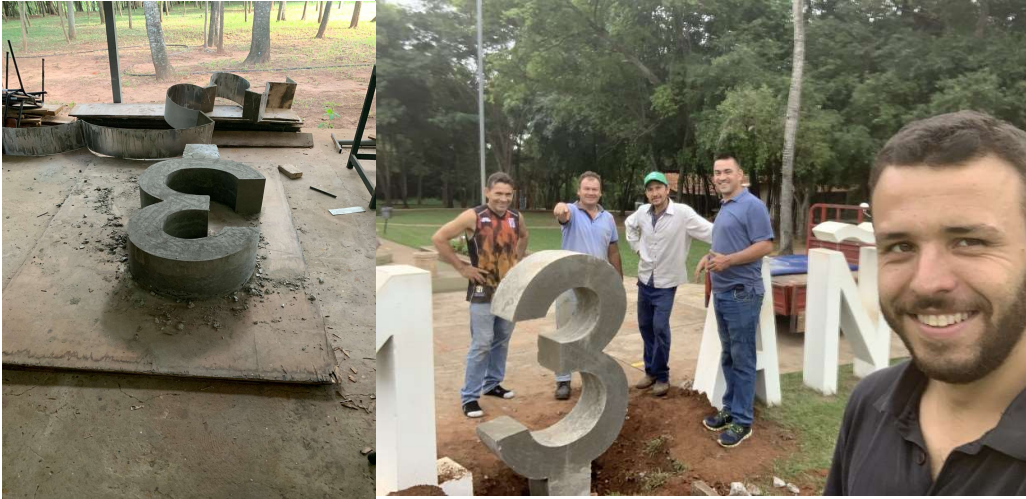
Anlässlich zum 13. Jahrestag der Schule wurden unsere Betonzahl 0 durch 3 ersetzt.