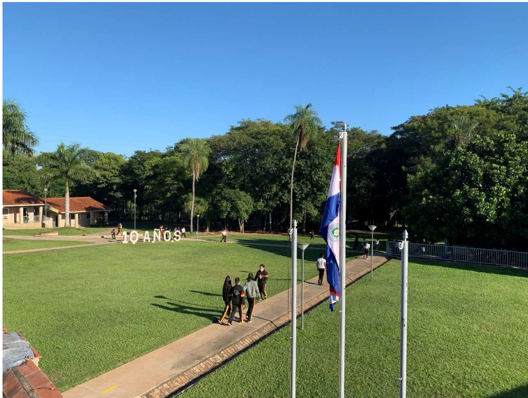
Der Schulhof mit der Nationalflagge