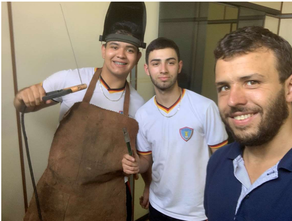
Die Oberstufe durfte sich am Schweißgerät ausprobieren