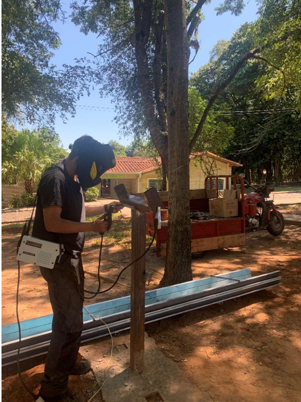
Ich beim Schweißen der neuen Rutschen