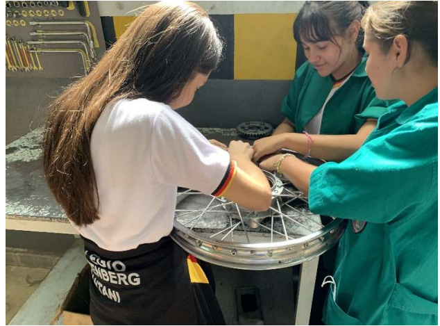
Die Mädels beim Speichen einsetzen

„Vielen für eure Gebete und eure finanzielle Unterstützung“