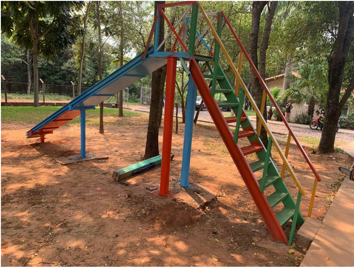
Fundament und Treppe haben wir nicht gebaut