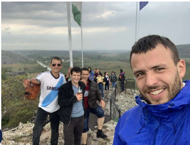
Meine Kollegen und ich beim Schulausflug