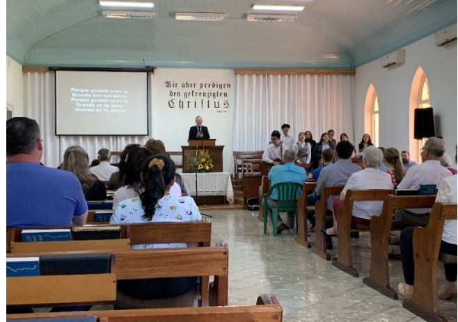
Unser Schulpastor bei der Predigt in der Kolonie Volendam

Möchtest du auch eine Patenschaft übernehmen? Besuche einmal die Internet-Seite des Kinderwerks Lima, dort kannst du dich melden, wenn du Interesse hast, um Kinder aus Sozialschwachen Familien eine gute Bildung zu ermöglichen.