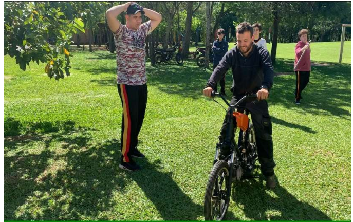
Ich auf dem Mofa bei der Jungfernfahrt

Die Schüler haben einen Motorroller, sowie ein Fahrrad vom Schrottplatz mitgebracht. Dann wurde der Motor komplett auseinandergelassen und wieder neu abgedichtet. Das alles wurde in Zusammenarbeit mit den Schülern realisiert.