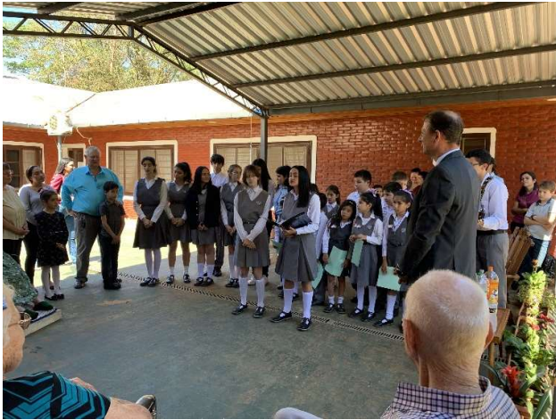
Ständchen singen im Altersheim