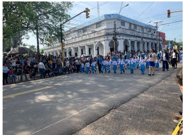
Kinder bei der Parade zum Geburtstag von der Stadt Santani