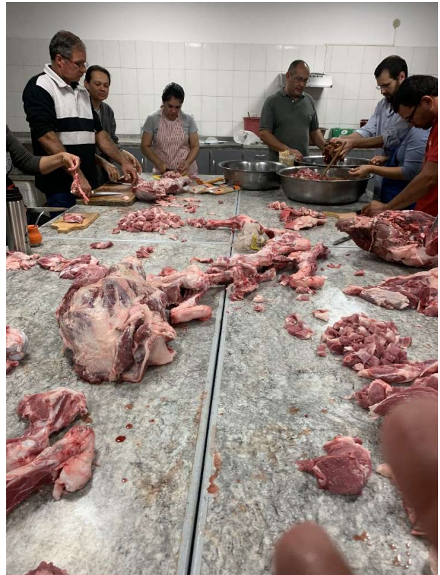
Die Kirchengemeinde vor Ort präpariert Fleisch am Spieß (Asadoito) für eine Sozialen Zweck. Manchmal ist man auch Metzger und muss Hand anlegen.