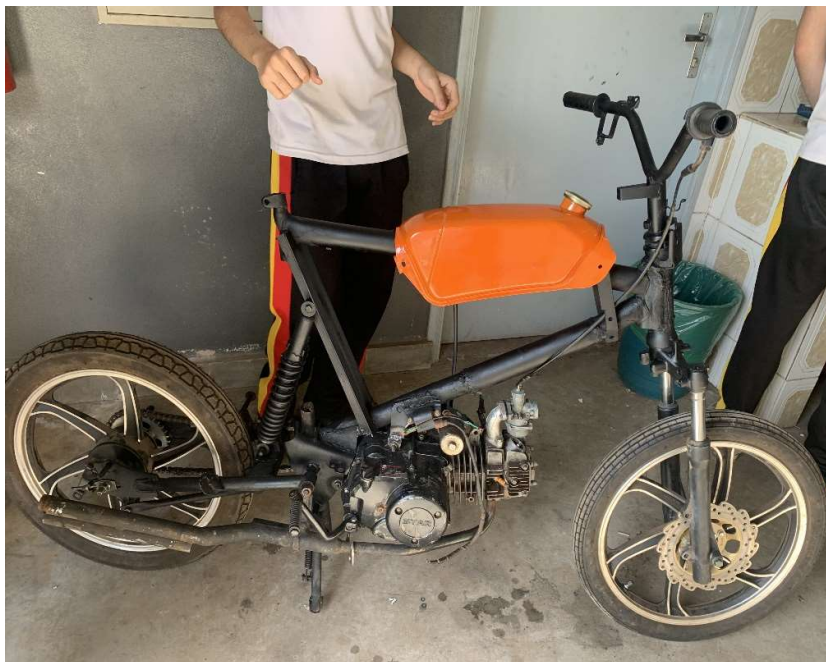
Das fertige Fahrzeug