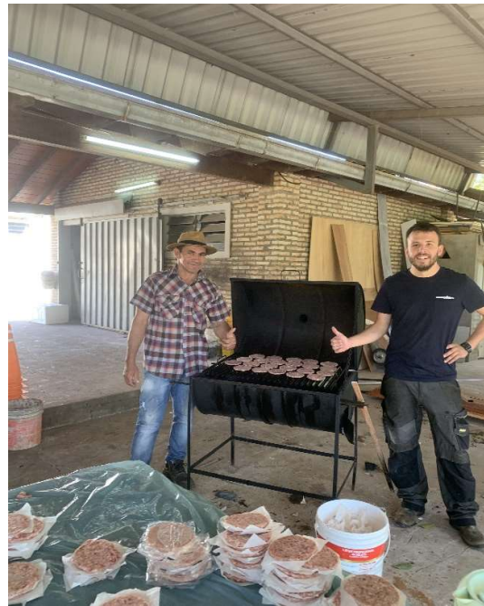
Hamburger grillen für die Kinder

Wir haben den Tag des Kindes gefeiert. An diesem Tag gibt es keine Schule und es wird gemeinsam gegrillt. Zum Essen gab es Hamburger.