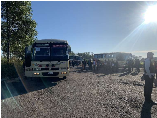
Unsere Busse im Einsatz für die Freizeit der Kinder

Abschließend kann ich sagen, dass es 3 wundervolle Tage mit sehr viel Spaß waren. Die mitgebrachten Trommeln haben den Lärmpegel deutlich erhöht und ich war froh, als diese verstummten. Ich hoffe, die Kinder haben die Tage sehr genossen und konnten einen geistlichen Anstoß mitnehmen und für sich etwas daraus lernen.