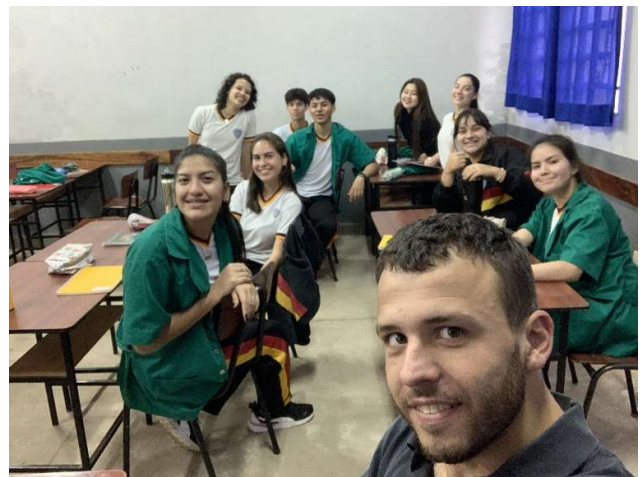
Der Spaß in der Klasse darf nicht fehlen