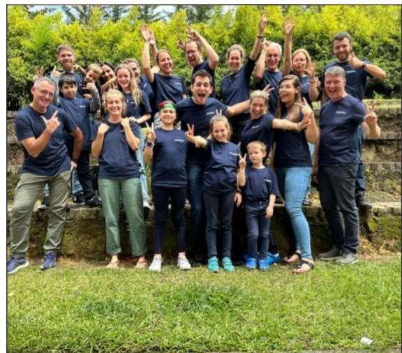
Fachkräfte vor Ort