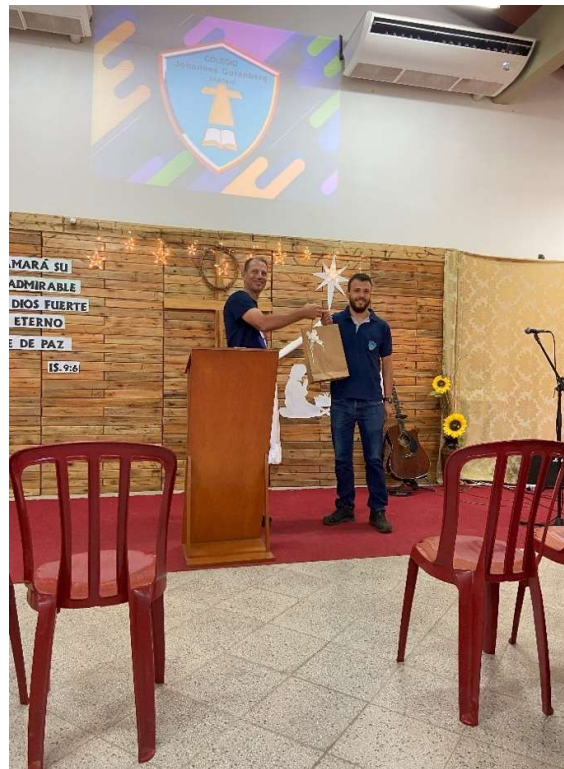
Offizieller Abschluss an der Schule