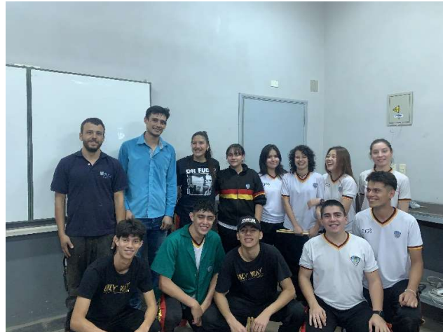
Abschluss Foto aus dem Klassenzimmer

Da ich aber bis August bei den CoWorkers vertraglich angestellt bin, werde ich die Schule in Paraguay wechseln. Das heist für mich und für Sie, dass ich wie bisher als Entwicklungshelfer tätig bin, aber nicht mehr an dieser Schule, sondern an einem Internat auch in Santani. Das Internat wird von der Organisation „Kreuz des Südens“ getragen. Dieses Internat hilft indigenen Jugendlichen eine Schulausbildung zu erlangen. Durch meine bisherige Arbeit, habe ich hier Freunde gewonnen. Einer davon ist Mitarbeiter dieser Organisation wodurch ich die Möglichkeit bekommen habe die Schule zu wechseln. Dort werde ich auch im Bereich Motorrad-mechanik tätig sein. Ich bin dankbar für diese Möglichkeit und freue mich auf die neue Herausforderung.