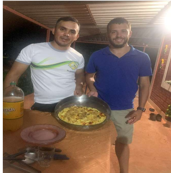
Käsespätzle mit Käse Paraguay

Auf dem rechten Foto habe ich die schwäbische Küche vorgeführt, was den Leuten sehr gut geschmeckt hat.