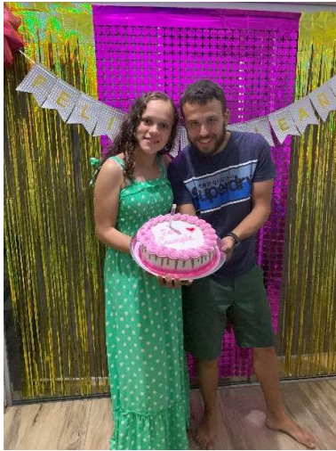
Unsere Geburtstage liegen nah beieinander, hier ein Geburtstagsfoto