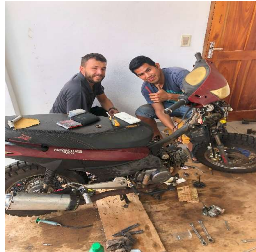
Hier mit einem Studenten den Zylinderkopf repariert

Meine Hauptaufgabe besteht darin, die Motorräder durch einfache Reparaturen wieder fit zu machen und den Studenten beizubringen, wie sie mit einfachen Handgriffen die Motorräder in Schuss halten können.